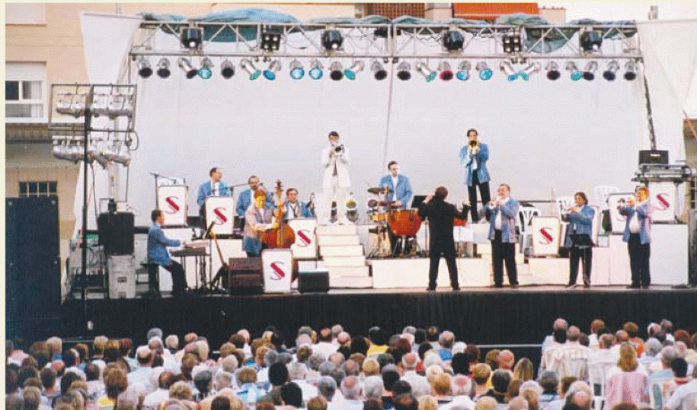
L'actuació de la Selvatana aplega centenars de vilassarencs

La formació de Cassà de la Selva oferirà en el concert un repertori que tindrà molt present la música popular potenciant la música catalana i on peces com la Santa Espina no hi faltaran. Segons expliquen, "es combinaran peces tradicionals, bandes sonores de pel·lícules, sarsuela, amb un ampli ventall d'estils per a tots els gustos". El nom de l'orquestra Selvatana va lligat amb el de Festa Major. Amb més de 90 anys de trajectòria la Selvatana es converteix en imprescindible dels grans esdeveniments.